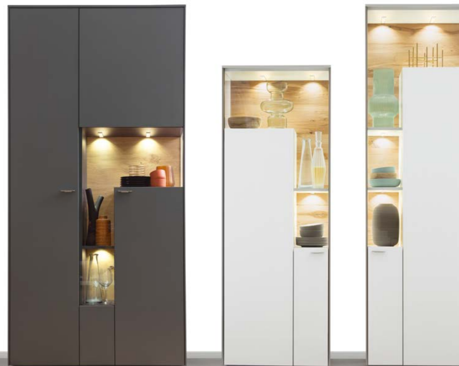
Vitrine 5295-3616R: BHT 102/207/43 cm • Lack schiefergrau matt, Wildeiche hell soft gebürstet geölt • Aluleiste schiefergrau matt Cabinet 5295-3616R: WHD 102/207/43 cm • Lacquered slate grey matt, Wild oak light soft brushed oiled finish • Aluminium ledge slate grey matt

This is the unmistakably exclusive signature of SENTINO 3000: The glass doors over the corner reveal the real wood veneer rear panel, look like an upside-down "L" and immediately give any room an ambience that's second to none. All the more so when they are illuminated.