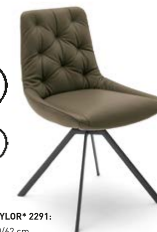
STUHL TAYLOR* 2291: BHT 53/90/62 cm