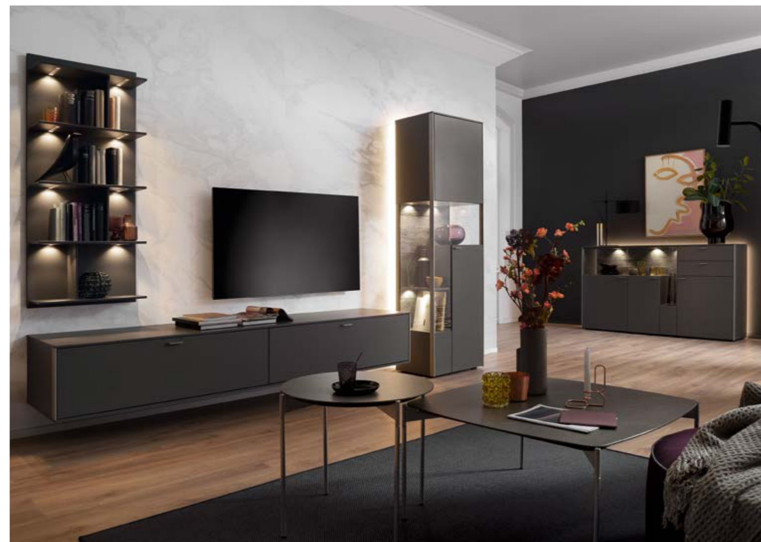
Kombination SI04-3617L: BHT 324/207/53 cm • Sideboard 5263-3617R: BHT 182/105/43 cm • Lack schiefergrau matt, Fjord Fichte grau • Aluleiste metallfarbig matt • Couchtisch RIO* 4942-1766M: LBH 83/83/42 cm • Beistelltisch RIO* 4946-1766L: LBH Ø 55/49 cm • Edelstahl optik, Keramik pazifikgrau

*Bei den Modellnamen handelt es sich nicht um eine Marke, sondern um ein reines Bestellzeichen zur Unterscheidung der einzelnen Produkte aus unserem Sortiment.