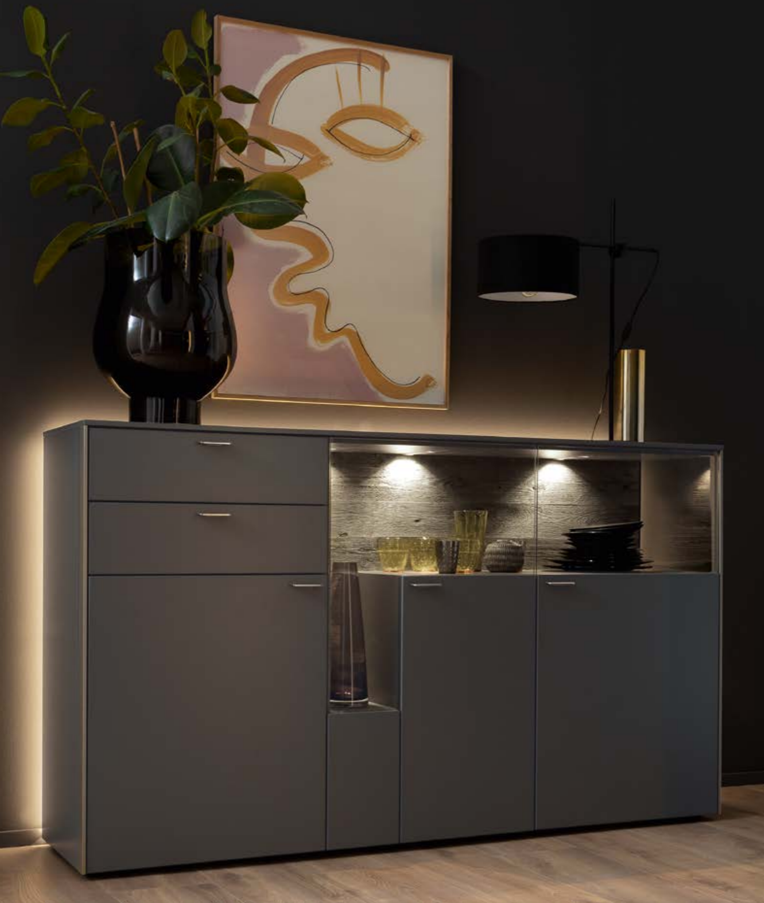
Sideboard 5263-3617L: BHT 182/105/43 cm • Lack schiefergrau matt, Fjord Fichte grau • Aluleiste metallfarbig matt Sideboard 5263-3617L: WHD 182/105/43 cm • Lacquered slate grey matt, Fjord spruce grey • Aluminium ledge metal coloured matt

*Bei den Modellnamen handelt es sich nicht um eine Marke, sondern um ein reines Bestellzeichen zur Unterscheidung der einzelnen Produkte aus unserem Sortiment.