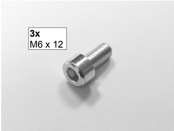
1. Montagematerial. 1. Fitting material.