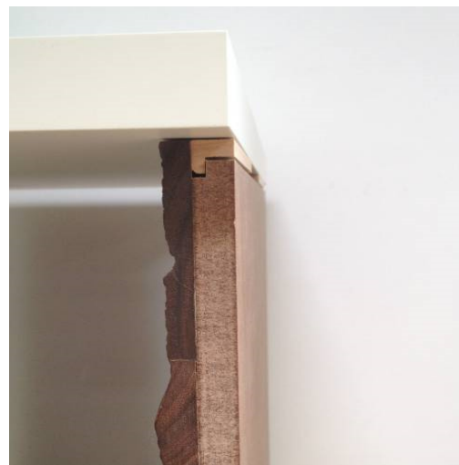
at the top